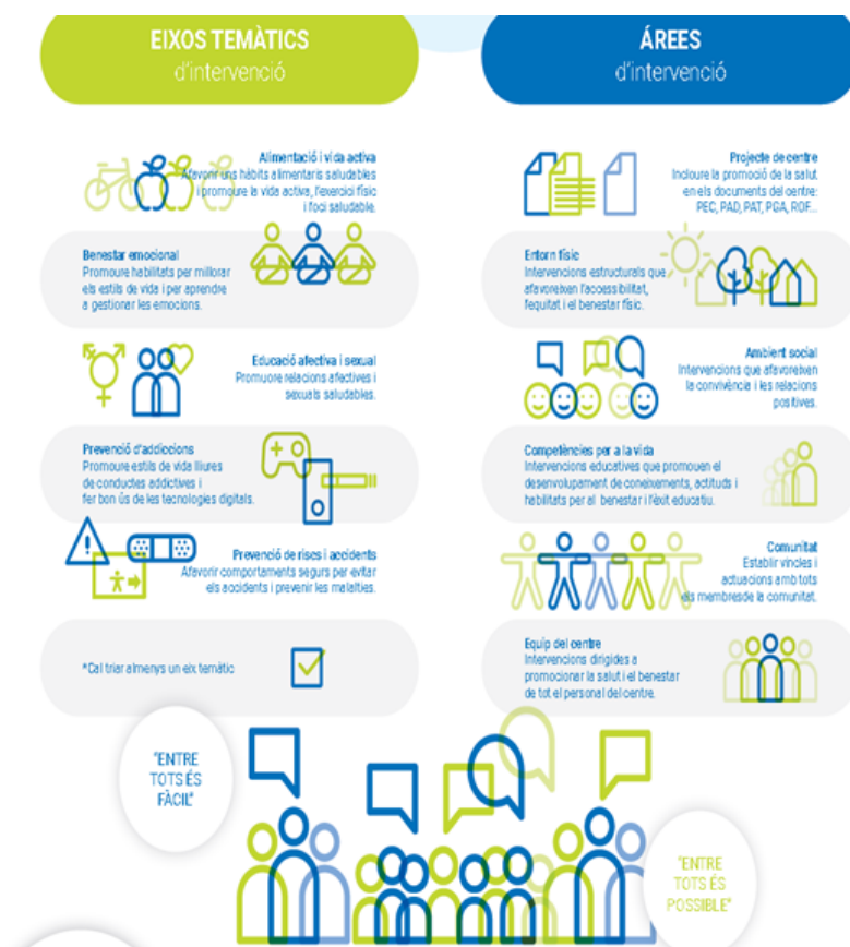
Figura 1. Eixos temàtics i àrees d'intervenció del programa CEPS