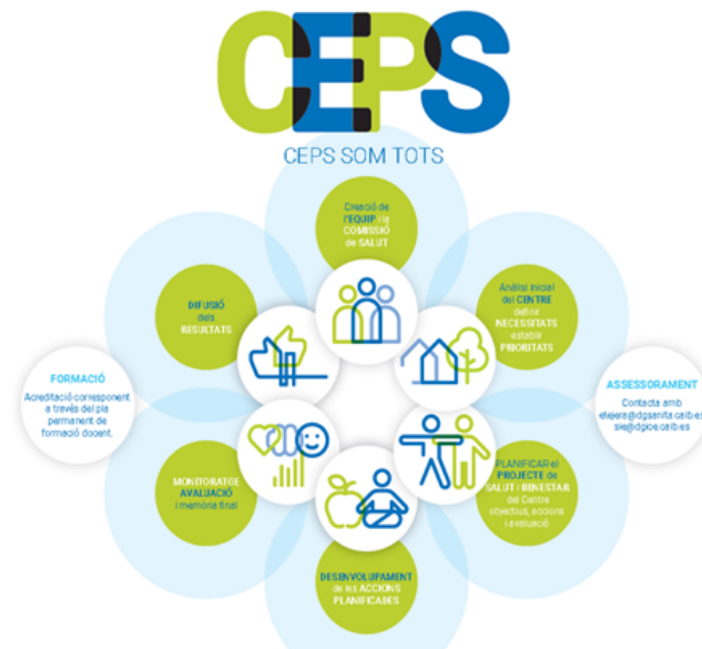
Figura 2. Etapes del programa CEPS